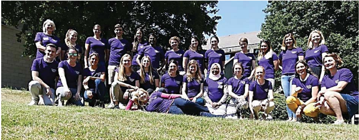
Die Teilnehmer der 7. French German Summer School 2019 in Liège