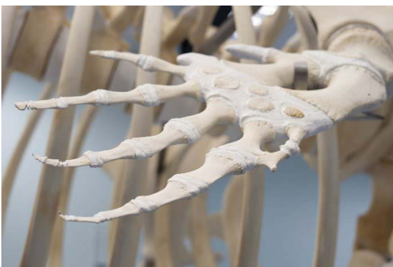
Anatomisch korrekte Präparation.