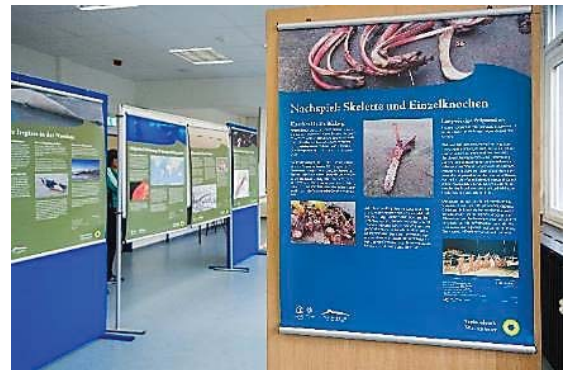
Ein Blick in die Wanderausstellung.

Wie so oft hängt der Erfolg einer Veranstaltung von vielen engagierten Personen ab. Daher gilt mein Dank zunächst allen Referentinnen und Referenten für ihre faszinierenden Vorträge, allen Organisatoren und Beteiligten für die konstruktive und harmonische Zusammenarbeit: