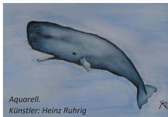
Aquarell. Künstler: Heinz Ruhrig

Umsetzung und Verwirklichung der Vereinsziele sind jedoch nur durch unsere derzeit rund 260 Mitglieder möglich, die durch ihre Mitgliedsbeiträge, Spenden und ihr Interesse an der Veterinärmedizin in Gießen eine tragfähige Basis zur Durchführung der entsprechenden Fördermaßnahmen schaffen. Ein herzliches Dankeschön geht daher an dieser Stelle an alle Mitglieder des VFFV.