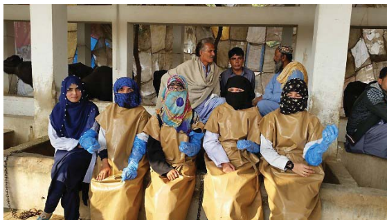
Kursteilnehmerinnen warten auf ihren Einsatz bei den Rektalisierungsübungen.