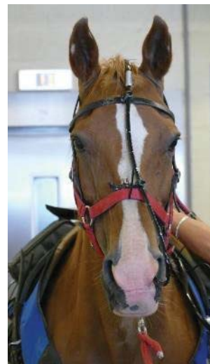
Praktische Demonstrationen an Hund und Pferd auf einem Laufband

Am 10.7. war Kleintier-Physiotherapie, -Orthopädie und -Bildgebungstag. Externe international anerkannte Redner hielten Vorträge zu verschiedenen Themen. Danach wurde die „Force Plate“ an Hund und Mensch vorgestellt und demonstriert. Hierbei handelt es sich um Gangbildanalyse durch Druckmessung. Einen Tag wurde Ernährung besprochen. Schwerpunkt bildete hier die leistungsgerechte und angepasste Ernährung von Hunden und Pferden im Training. Danach wurde das SHIME (eine künstliche Nachbildung des Magen-Darm-Traktes) besichtigt.