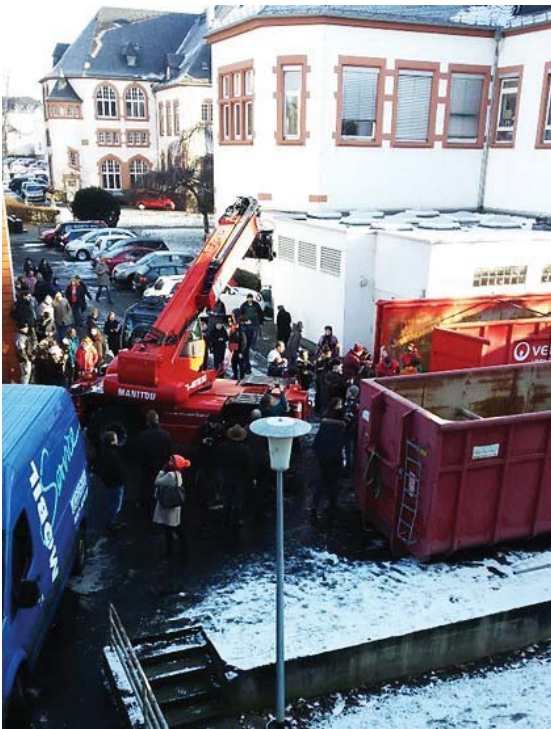
Die Ankunft des Wals in Gießen.